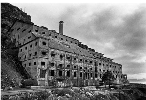
© Loris Poidvin, Canari , 2008