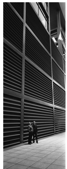
© Loris Poidvin, Madrid , 2010