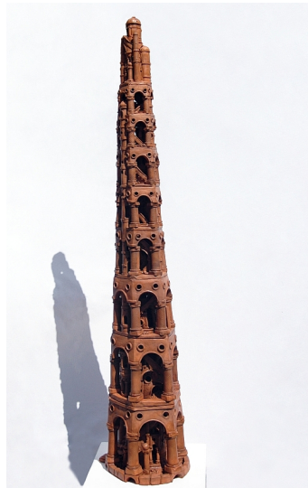
© Pierre Poidvin, Tour de Babel , 2014