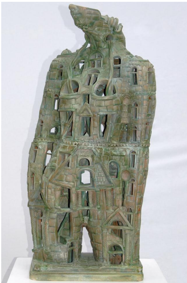
© Pierre Poidvin, Jezabel VII, 2013

Pierre Poidvin naît à Caen en 1945, s'intéresse très jeune au dessin et à la peinture. Tombé amoureux de la Corse à l'âge de 11 ans, il s'y installe définitivement en 1969 en ouvrant un atelier d'art à Porto, puis à Ajaccio. Il y expose tableaux, bijoux et objets en terre cuite. Il abandonne progressivement la peinture au profit du modelage de la terre cuite, celle-ci offrant de plus grandes possibilités formelles. Il se passionne également pour l'archéologie et s'intéresse aux gestes et techniques de la céramique préhistorique.