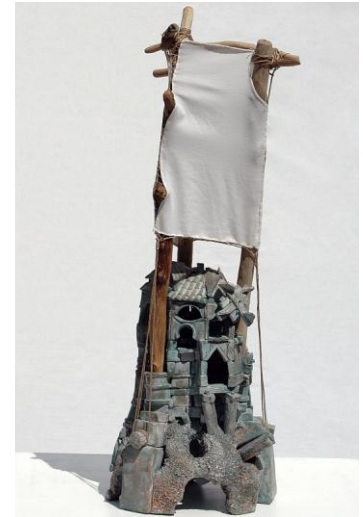
© Pierre Poidvin, Tintinnabulum VI , 2014