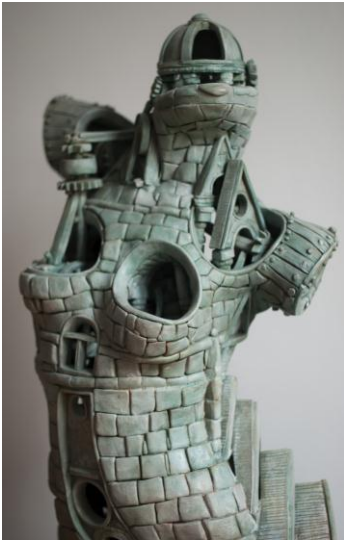
© Pierre Poidvin, Jezabel VI , 2012