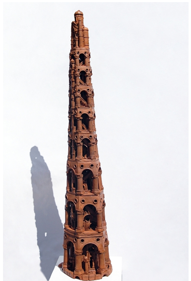
© Pierre Poidvin, Tour de Babel, 2014